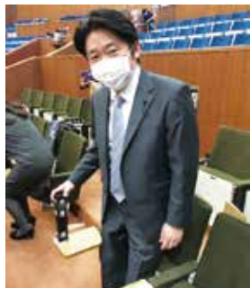
新型コロナウイルス対策のため通常とは異なる席で議場に参加しました。

令和2年6月定例県議会が行われ、追加提案分 1,867億4,800万円 を含む総額補正予算 2,048億8,600万円 が可決されました。可決成立された議案は21件となります。これにより今年度総額予算は、過去最大の一般会計予算 2兆475億8,800万円 となりました。